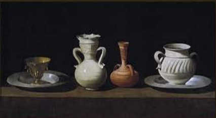
Francisco de Zurbarán (1598-1664) Bodegón con cacharros 1650 Museo del Prado - Madrid