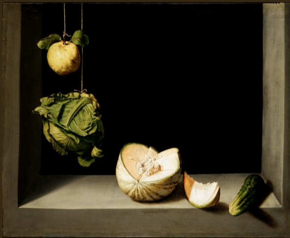
Juan Sánchez Cotán (1560-1627) Bodegón con membrillo, repollo, melón y pepino 1602 San Diego Museum of Art